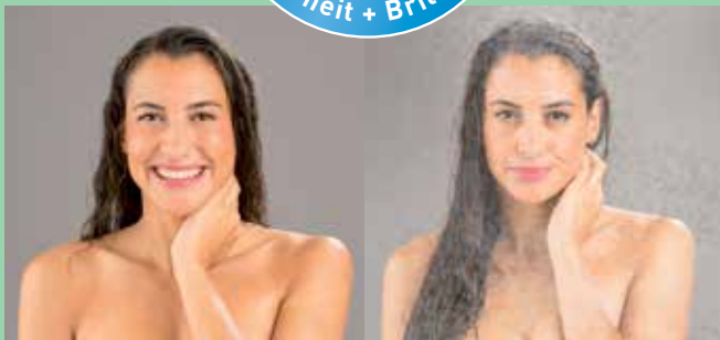
DURACLEAR von EUROGLAS nach 10 Jahren Benutzung